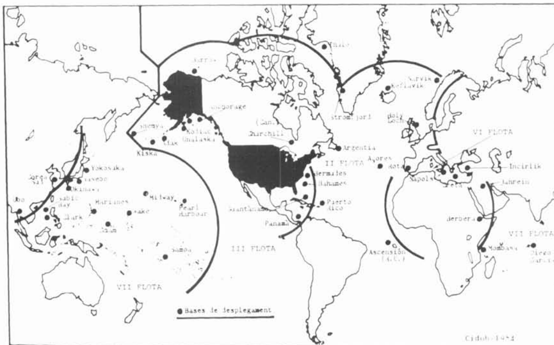
REPARTIMENT DE LA SEUERA I DESPLIAMENT ESTRATÈGIC DE L'ESTAT UNITIÀ