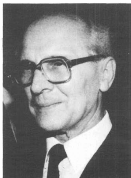
No-show guest: East Germany's Honecker