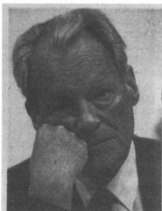
Ex-Chancellor Willy Brandt