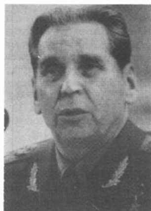
Going out: Ogarkov