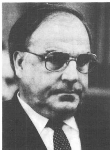
Stood-up host: West German Chancellor Kohl