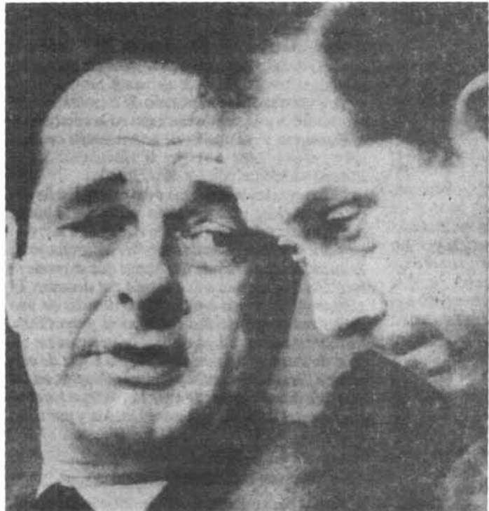
Chirac i el seu ministre de l'Interior

Aquesta mesura d'excepció, adoptada després d'una onada d'atemptats terroristes a la capital francesa, va afectar 42 països amb els quals l'estat francès tenia firmats