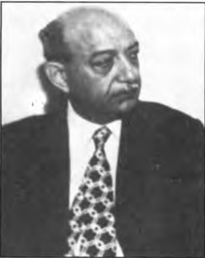
L'egipci Mohamud Riad, secretari general de la Lliga d'Estats Àrabs del 1972 al 1979, període de màxima activitat del DEA.

L'evolució positiva de la conjuntura internacional, un seguit de nous interessos i preocupacions tant per part europea com àrab (seguretat, migracions, islamisme, desenvolupament) i el nou impuls a la política mediterrània de la UE fan que arribem a finals dels vuitanta amb el sorgiment de noves propostes sobre les relacions amb els socis mediterranis. En aquesta nova etapa el relleu del DEA es circumscriuria a la regió mediterrània amb projectes com la Conferència sobre la Seguretat i Cooperació a la Mediterrània (CSCM), la Iniciativa 4 + 5 (relacions entre els quatre socis comunitaris de la regió i els cinc països del Magrib Àrab) i la propera Conferència Euro-mediterrània de Barcelona. ■