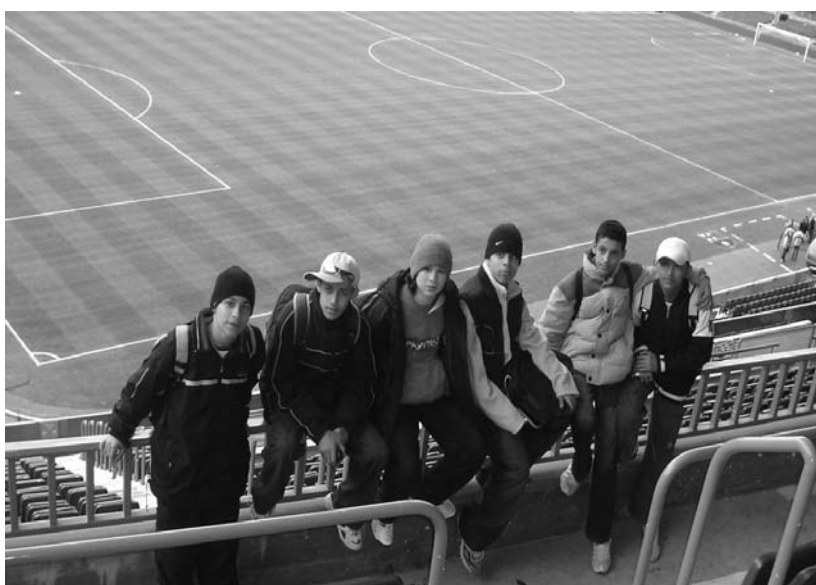
Visita escolar al Camp Nou.

De acuerdo con las redacciones, lo diferencial de las vidas de los adolescentes en Barcelona está marcado por la diversidad cultural de las amistades, por la oferta de actividades de ocio, por la buena dinámica de intercambio que se produce en algunos barrios, por el aprendizaje del idioma y, también, por la vida escolar