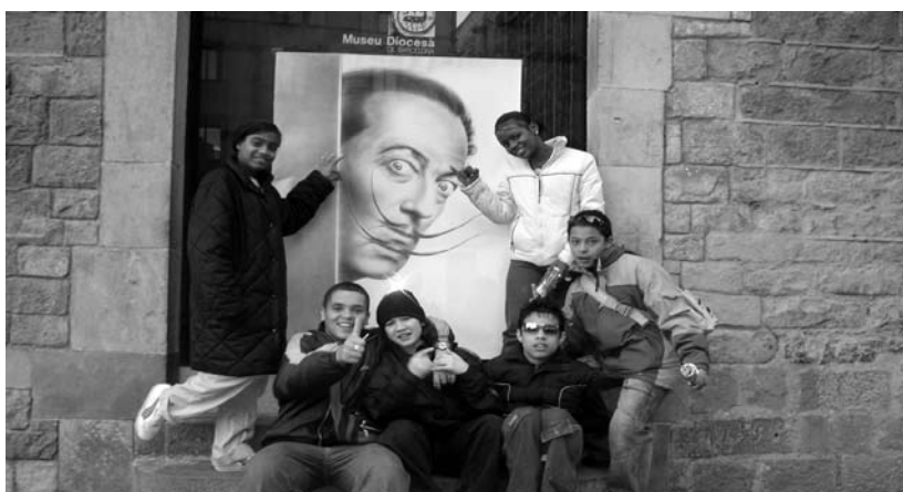
Visita escolar al museo