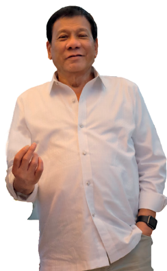
Rodrigo Duterte El huracán presidencial