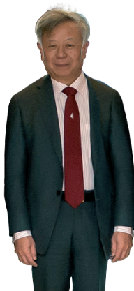
Jin Liqun El banquero global

Tras años de acercamiento entre ambos lados del estrecho, el retorno de los nacionalistas al gobierno de Taipei auguraba un recrudecimiento que quedó disperso por el enfoque inicial de Tsai, que priorizó valientes decisiones internas de carácter social, participativo y de control de los lobbies . Sin embargo, la sorprendente llamada del presidente electo Trump en el mes de diciembre, previa a cualquier contacto con Beijing, desató las alarmas y podría situar a la isla en el centro de una lucha emergente entre los dos titanes.