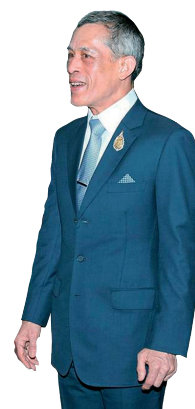
Vajiralongkorn Herederero de una gran responsabilidad

Tras años de lucha política y arresto domiciliario, que le valieron el Premio Nobel de la Paz en 1991, tras su llegada al gobierno, Aung San Suu Kyi prioriza la reconciliación política, relegando a un plano discreto uno de los conflictos étnicos más graves del país, el de la minoría musulmana de los Rohingya que es víctima, según los observadores internacionales, de una limpieza étnica que alimenta olas de desplazados. La negativa de Suu Kyi a llamarles por su nombre y considerarlos foráneos, es además de un borrón en su lucha por los Derechos Humanos, un gesto de debilidad frente al extremismo budista.