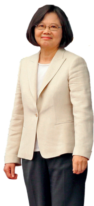
Tsai Ing-wen Nadando entre colosos

Desde su llegada a la presidencia de Filipinas, en junio de 2016, Duterte ha captado la atención internacional por sus insultos hacia líderes internacionales como Obama o el Papa Francisco y por su empeño en acabar con el tráfico de drogas y el crimen en su país a cualquier precio, incluyendo ejecuciones extrajudiciales que ya han costado la vida de miles de personas. Lejos de ser un outsider , Duterte es un político veterano. Sin embargo, es rupturista ya que se propone romper la alianza militar con los EEUU y abrazar a China.