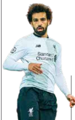
Mohamed Salah Ídolo y modelo para la juventud egipcia

El 2 de octubre un comando de agentes especiales asesinó brutalmente a este periodista crítico en el consulado saudí en Estambul. Tanto su desaparición como los métodos empleados generaron una fuerte ola de indignación mundial. Muchas voces apuntaron hacia el príncipe heredero, Mohamed bin Salman, como el instigador de este asesinato. Los aliados internacionales de Arabia Saudí se vieron sometidos a mayor presión y se redobló la campaña internacional para intentar detener la catástrofe humanitaria en Yemen.