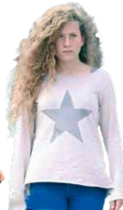
Ahed Tamimi Nuevo símbolo de la resistencia palestina

Uno de los grandes acontecimientos internacionales de 2018 fue el Mundial de Fútbol en Rusia. Uno de los jugadores más admirados en su país es Mo Salah, tanto por su virtuosismo en el terreno de juego como por su ejemplaridad en la vida privada. Salah es visto como una persona que a pesar del éxito sigue conservando humildad, modestia y generosidad. Su cuenta de Twitter ya ha alcanzado los siete millones de seguidores y como dato todavía más relevante, se dice que más de un millón de personas escribieron espontáneamente su nombre en las papeletas de la elección presidencial egipcia de marzo de 2018.