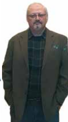
Jamal Khashoggi El asesinato de un periodista pone a Arabia Saudí en aprietos

A finales de abril de 2018 se inició en las redes sociales de Marruecos una campaña para boicotear diversas empresas nacionales como la petrolera Afriquia o el agua mineral Sidi Ali. El blanco de este boicot era Aziz Aknouch, ministro de Agricultura y segunda fortuna de Marruecos tras la del monarca Mohamed VI. La rapidez con la que se extendió la campaña y la popularidad que alcanzó se ha interpretado como una señal de fuerte malestar social que, de no abordarse, podría aumentar de intensidad. Por el momento no ha alcanzado a la figura del Rey, pero se le ha acercado.