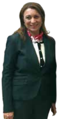
Souad Abderrahim Primera alcaldesa electa de una capital árabe

En julio de 2018 Abderrahim se convirtió en la nueva alcaldesa de Túnez en las primeras elecciones locales tras la caída del régimen de Ben Alí. Con estos comicios se completó el ciclo electoral iniciado en 2011. Los resultados en el conjunto del país fueron una señal de renovación (49% de cargos electos en manos de mujeres y 29% de alcaldesas, así como 37% de electos menores de 35 años), pero también de frustración de la población, ya que solo el 35% del censo acudió a las urnas. Abderrahim pertenece a Ennahda, un partido que proviene del islamismo político pero que ha ido moderando sus posiciones.