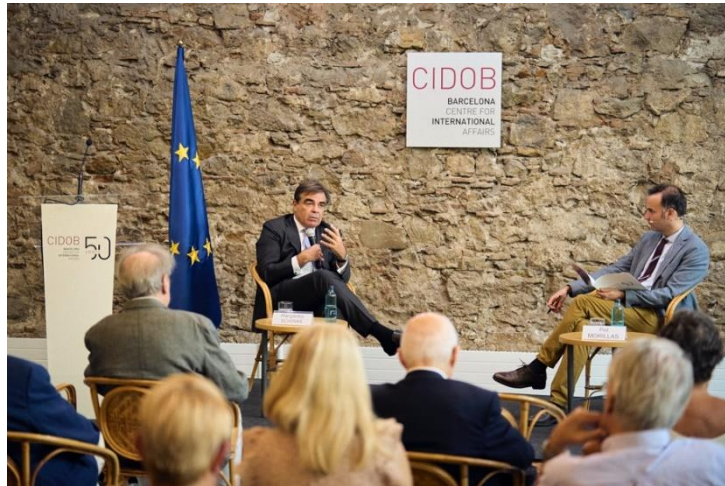
Margaritis Schinas y Pol Morillas durante el diálogo “Transiciones europeas, retos políticos” Sala Maragall, CIDOB, Barcelona, 14 de septiembre de 2023

ciberseguridad y amenazas híbridas–, el debate sobre la ampliación de la UE o el Nuevo Pacto de Migración y Asilo. El Diálogo se celebra un día después del discurso sobre el estado de la Unión 2023 (SOTEU) de la presidenta Von der Leyen y se enmarca dentro del proyecto DigiDem-EU de CIDOB financiado por el programa CERV de la Comisión Europea.