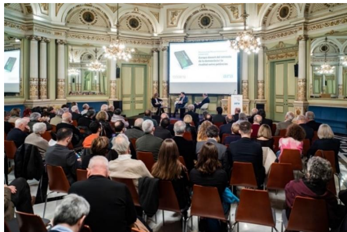
“Europa ante el retroceso de la democracia y la rivalidad entre potencias” Presentación del Anuario Internacional CIDOB 2023. 20 de diciembre de 2023