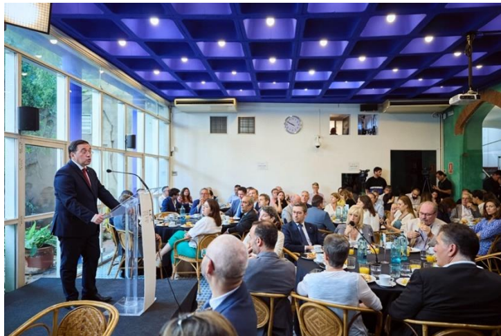
Desayuno CIDOB con José Manuel Albares, ministro de Asuntos Exteriores, Unión Europea y Cooperación. 10 de julio de 2023

>> Álbum de fotos: Desayuno CIDOB con José Manuel Albares, ministro de Asuntos Exteriores, Unión Europea y Cooperación