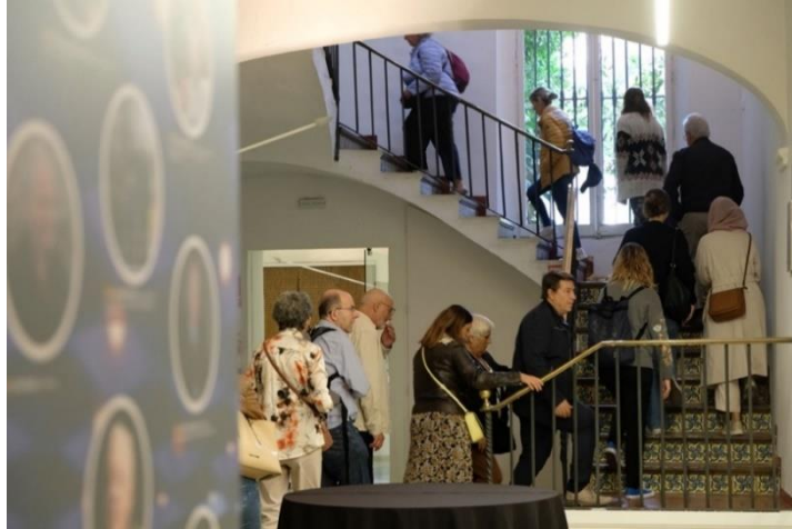
Jornada de Puertas Abiertas en CIDOB · 48h Open House, 22 de octubre de 2023

>> Álbum de fotos: Jornada de Puertas Abiertas en CIDOB · 48h Open House