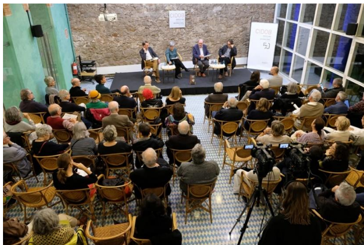
Ciclo “¿Qué pasa en el mundo?” El mundo de hoy. De la guerra fría a los retos de la interdependencia global. 20 de noviembre

Todas las sesiones se retransmiten en directo a través del canal institucional de YouTube, donde quedan recogidas para su posterior consulta por parte de las personas interesadas: