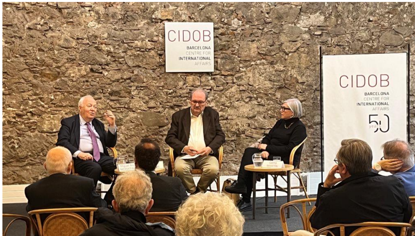
Europa y el mundo árabe en el nuevo contexto internacional, 25 de mayo de 2023

>> Vídeo: Europa y el mundo árabe en el nuevo contexto internacional