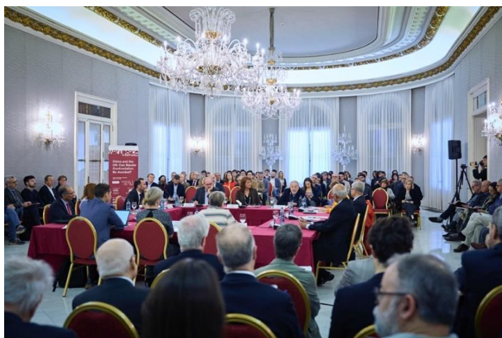
“China and the US: Can Bipolar Confrontation Be Avoided?” Palau de Pedralbes, 11 de marzo de 2023

>> Vídeo y entrevistas: ‘War&Peace 2023 · China and the US: Can Bipolar Confrontation Be Avoided?’