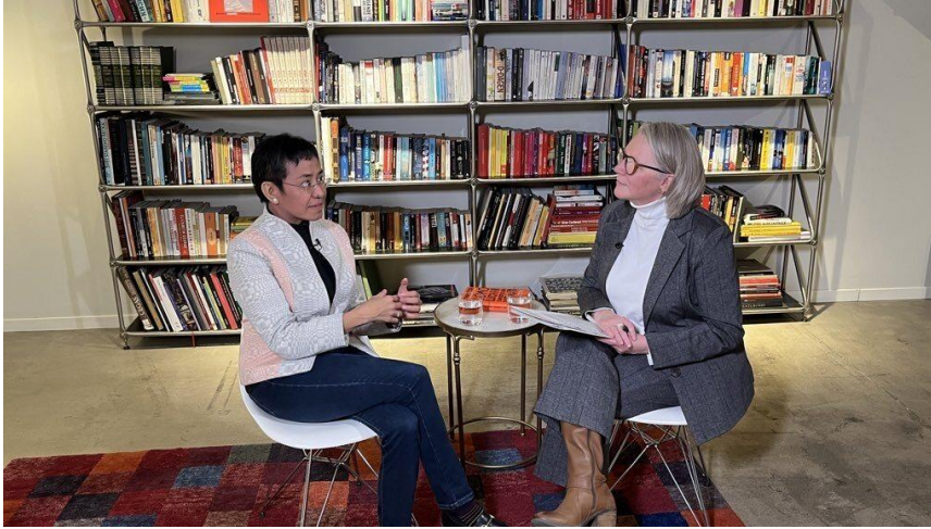
CIDOB In conversation with Maria Ressa, Nobel Peace Prize 2021, 18 de mayo de 2023

Las CIDOB In conversation with se graban, editan y emiten como un falso directo a través del canal de YouTube de CIDOB, donde quedan recogidas para su posterior consulta. En 2023, la serie de entrevistas CIDOB In conversation with acumula más de 6.500 visitas .