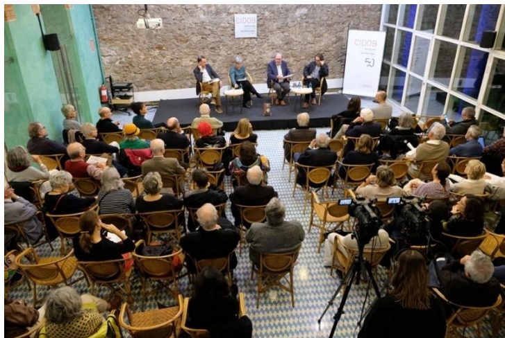
Cicle “Què passa al món?” El món d'avui. De la guerra freda als reptes de la interdependència global. 20 de novembre

Totes les sessions es retransmeten en directe a través del canal institucional de YouTube, on queden recollides per a la seva posterior consulta per part de les persones interessades: