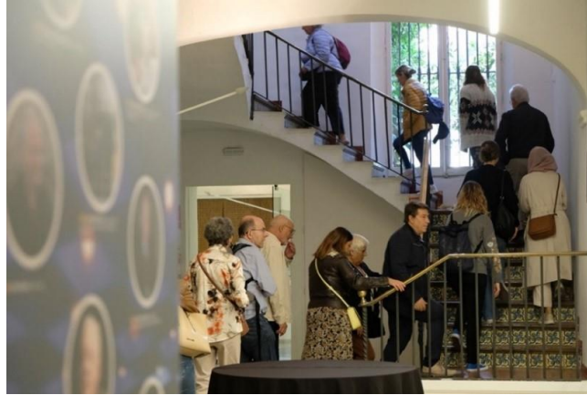
Jornada de Portes Obertes al CIDOB · 48h Open House, 22 d'octubre de 2023

el documental ' Bouncing back. World politics after the pandemic ' produït pel CIDOB. Al vestíbul de l'edifici els visitants van poder recórrer la història del CIDOB a través d'una línia del temps (timeline) i conèixer millor la història de la institució.