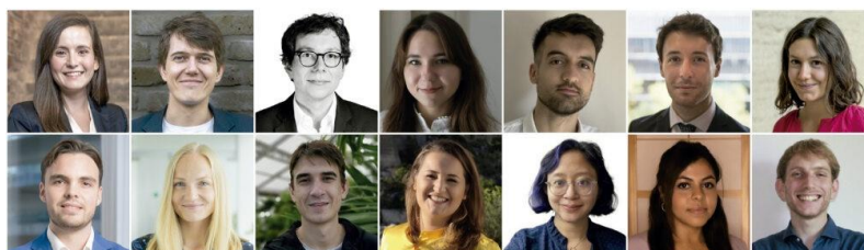
35 under 35 List