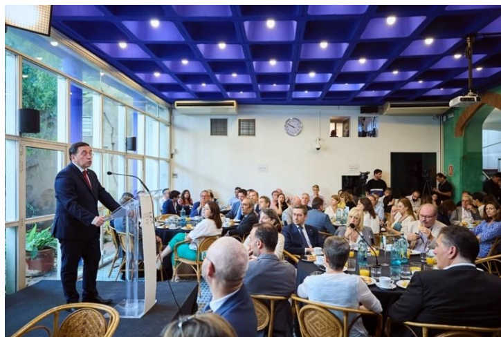
Esmorzar CIDOB amb José Manuel Albares, ministre d'Afers Exteriors, Unió Europea i Cooperació. 10 de juliol de 2023

>> Àlbum de fotos: Esmorzar CIDOB amb José Manuel Albares, ministre d'Afers Exteriors, Unió Europea i Cooperació