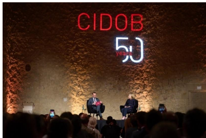
“A life in global politics”, una conversa amb Hillary Rodham Clinton. 2 de juny de 2023

Aquest diàleg amb Hillary Rodham Clinton durant la seva primera visita a Barcelona va ser l'acte central del 50è aniversari del CIDOB. La conferència, a la qual van assistir prop de 200 persones , va tenir lloc a La Capella del MACBA.