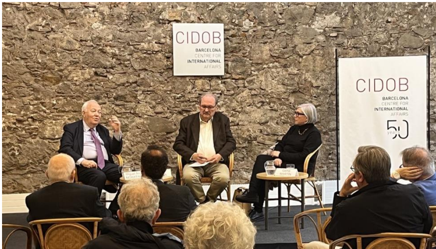
Europa i el món àrab en el nou context internacional, 25 de maig de 2023

>> Vídeo: Europa i el món àrab en el nou context internacional