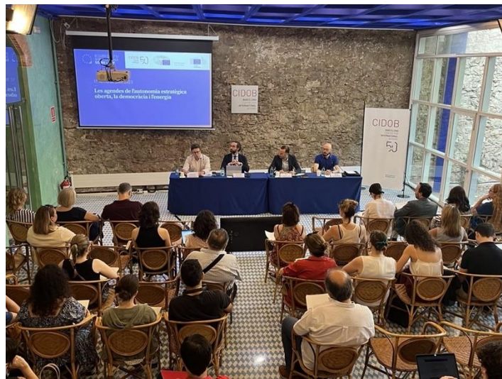
III Curs d'Estiu Sofia Corradi sobre la Unió Europea Sala Maragall, CIDOB, Barcelona, 17, 18 i 19 de juliol de 2023

Després de l'èxit de les anteriors edicions, l'oficina del Parlament Europeu a Barcelona, la Representació de la Comissió Europea i el Centre for International Affairs (CIDOB) mantenen la seva aposta amb el tercer curs d'estiu sobre la Unió Europea. Els tres dies lectius són sessions monogràfiques enfocades des d'una perspectiva teòrica i pràctica. Les sessions es divideixen en una intervenció per un key-note speaker de la Comissió o el Parlament Europeu, seguit d'un diàleg amb un periodista; i una taula rodona que compta amb investigadors de CIDOB; funcionaris de les institucions europees i experts independents. L'objectiu d'aquest curs d'estiu és oferir als participants una perspectiva completa dels debats i reptes de la Unió Europea a curt, mitjà i llarg termini, i dotar-los d'eines perquè puguin analitzar i comprendre la realitat europea i prendre partit de forma activa.