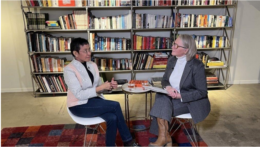
CIDOB In conversation with Maria Ressa, Nobel Peace Prize 2021, 18 de maig de 2023

Les CIDOB In conversation with s'enregistren, editen i emeten com un fals directe a través del canal de YouTube de CIDOB, on queden recollides per a la seva posterior consulta. L'any 2023, la sèrie d'entrevistes CIDOB In conversation with acumula més de 6.500 visites .