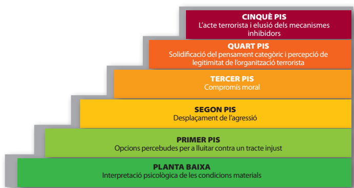
Figura 3: L'escala del terrorisme

es va elaborar amb la finalitat específica d'explicar els atacs suicides amb bomba, i és totalment possible que les cinc fases no es puguin extrapolar a un univers de casos gaire ampli.