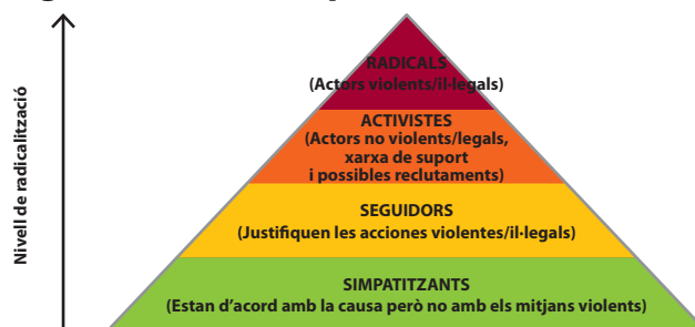
Figura 4: Model de la piràmide

Els autors del model són Clark McCauley i Sophia Moskalenko, dos psicòlegs que conceptualitzen "la radicalització política com a canvi en les creences, els sentiments i l'acció envers el suport i el sacrifici pel conflicte intergrupal" (2008: 428). Però una de les observacions més interessants del seu treball és que molts dels mecanismes de radicalització de persones i grups en general són reactius. Els factors no són intrínsecs de determinades persones, sinó que es troben en els contextos que les envolten. És, essencialment, un plantejament relacional i la radicalització de grups no estatals es pot interpretar com una resposta a les accions d'altres actors. En paraules de McCauley i Moskalenko: "La radicalització política de les persones, els grups i les masses té lloc en una trajectòria d'acció i reacció en la qual l'acció estatal sovint té un paper significatiu. La radicalització emergeix en una relació de conflicte i competència intergrupal en la qual totes dues bandes es radicalitzen. I és aquesta relació la que s'ha d'entendre si es vol atacar directament el terrorisme."