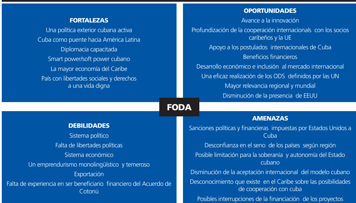
Gráfico 2: análisis FODA