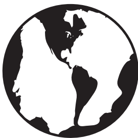
Figura 2. Logo de La Gaceta de la Iberosfera

en 2020 su propio think tank , con el nombre de Fundación Disenso, con la vista puesta en el nuevo concepto de la iberosfera , y fundó una plataforma digital bautizada precisamente con el nombre de La Gaceta de la Iberosfera el 12 de octubre de ese mismo año (véase la figura 2). Este diario en línea recoge noticias de diversos países de habla hispana y elabora columnas de opinión de signo ideológicamente liberal en lo económico y conservador en lo moral. En ellas se reflejan posiciones contrarias a los gobiernos de Argentina, Venezuela, Chile, Nicaragua, Cuba o Perú.