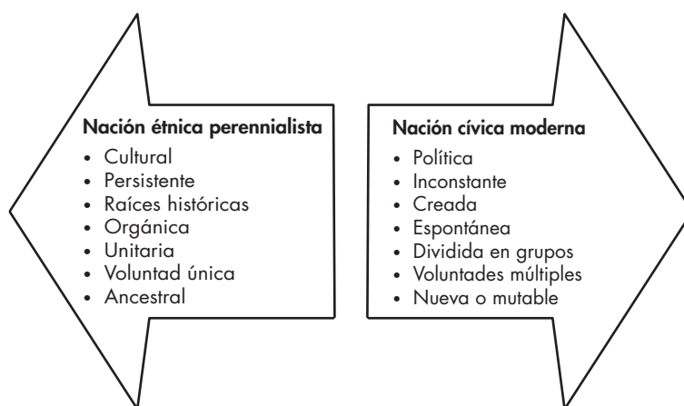
Figura 1. Nación étnica perennialista y nación cívica moderna