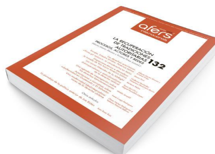
Revista CIDOB d'Afers Internacionals 132

LA RECUPERACIÓN DE TRADICIONES AUTORITARIAS: procesos, actores y redes