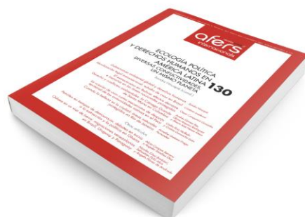
Revista CIDOB d'Afers Internacionals 130

ECOLOGÍA POLÍTICA Y DERECHOS HUMANOS EN AMÉRICA LATINA: diversas conflictividades, un mismo planeta