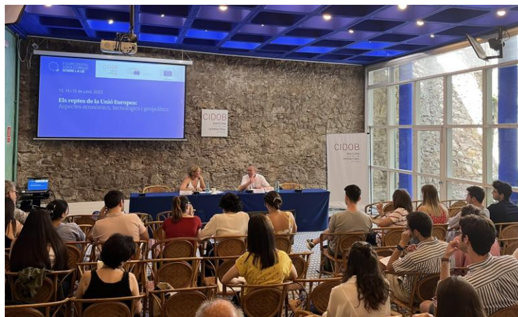
II Curso de Verano Sofia Corradi sobre la Unión Europea Sala Maragall, CIDOB, Barcelona, 12, 14 y 15 julio de 2022

Tras el éxito de la primera edición, la oficina del Parlamento Europeo en Barcelona, la Representación de la Comisión Europea y el Barcelona Centre for International Affairs (CIDOB) mantienen su apuesta con el segundo curso de verano sobre la Unión Europea. Los tres días lectivos son sesiones monográficas, enfocadas desde una perspectiva teórica y práctica. Las sesiones se dividen en una intervención por parte de un key-note speaker de la Comisión o el Parlamento Europeo, seguido de un diálogo con un periodista; y una mesa redonda que cuenta con investigadores de CIDOB; funcionarios de las instituciones europeas y expertos independientes. El objetivo de este curso de verano es ofrecer a los participantes una perspectiva completa de los debates y retos de la Unión Europea en el corto, medio y largo plazo, y dotarlos de herramientas para que puedan analizar y comprender la realidad europea y tomar partido de forma activa.