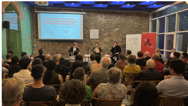
Ciclo “¿Qué pasa en el mundo?” El futuro de China tras el XX Congreso Nacional del Partido Comunista. Sala Maragall, CIDOB, Barcelona, 24 de octubre

Todas las sesiones se retransmiten en directo a través del canal institucional de YouTube, donde quedan recogidas para su posterior consulta por parte de las personas interesadas: