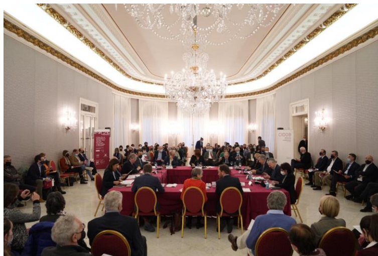
“ A New Era of Geopolitics in Europe: How Can the EU Secure a New Peace in Ukraine? ” Palau de Pedralbes, Barcelona, 12 de marzo de 2022

Organizado por: CIDOB con la colaboración de EsadeGeo y el apoyo de la Fundación “la Caixa” y sus patrones institucionales