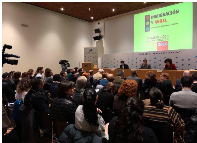
Presentación Anuario CIDOB de la Inmigración, 20 de febrero de 2020, CaixaForum Madrid