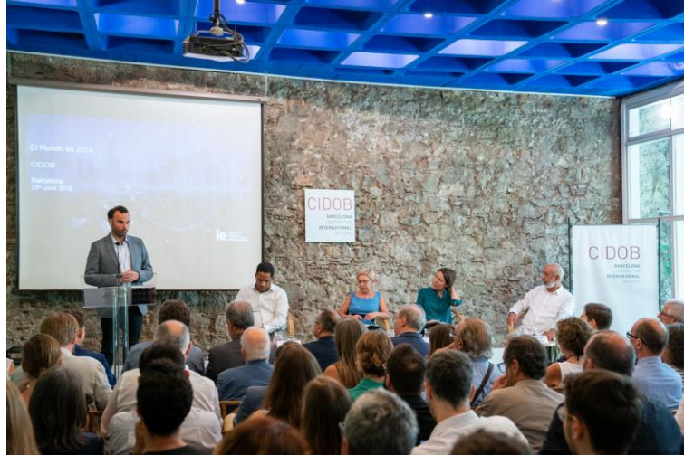
Presentación Anuario Internacional CIDOB 25 de junio de 2019, Sala Jordi Maragall