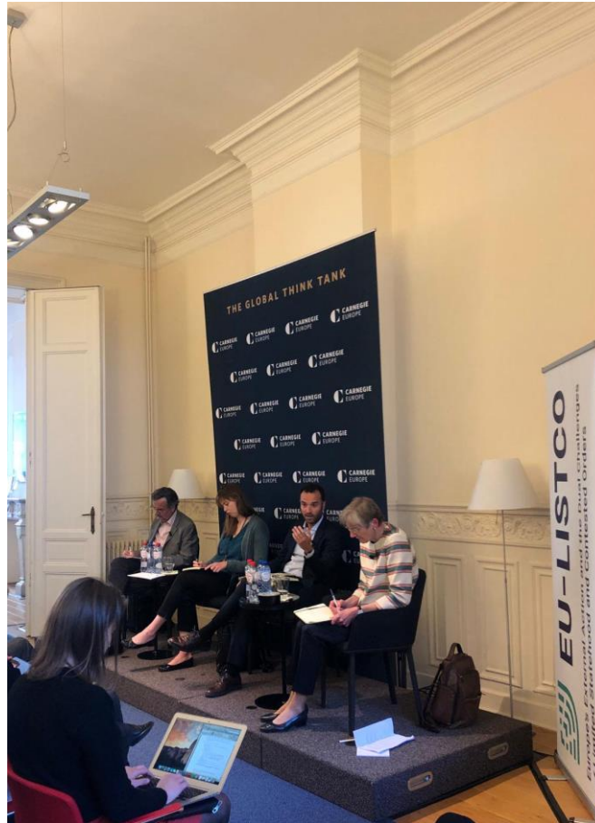
"Foreign Policy in Europe's Borderlands" 15 de mayo de 2019, Carnegie Europe, Bruselas