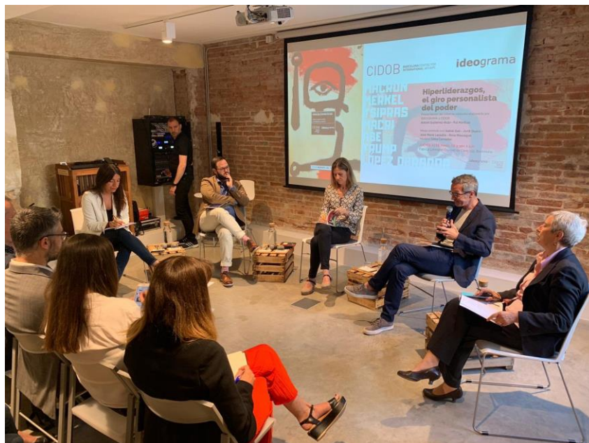
Hiperliderazgos, el giro personalista del poder, 13 de junio, Fábrica Lehmann