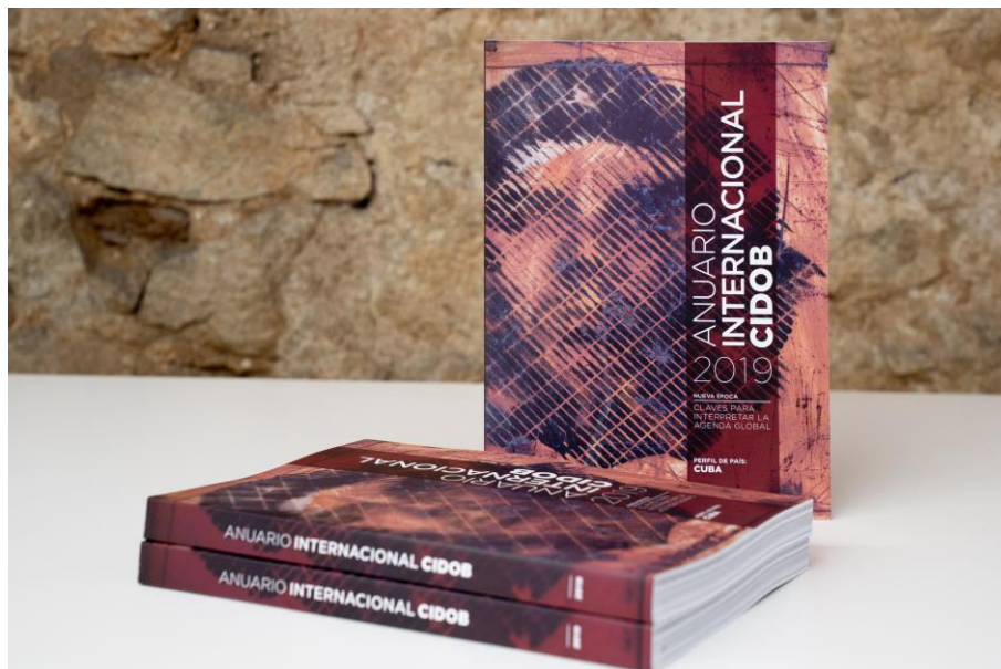
Anuario Internacional CIDOB 2019

En su 29ª edición y coincidiendo con el 60 aniversario de la Revolución, el Anuario dedica su Perfil de País a Cuba , un país que se debate entre la reforma y la continuidad.