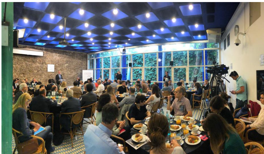
Desayuno CIDOB con Jaume Duch , Sala Maragall CIDOB, Barcelona, 4 de junio