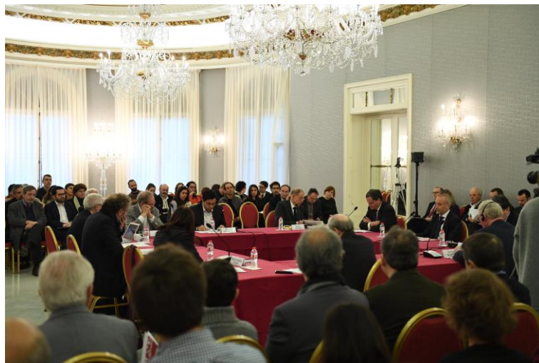
Colombia: el proceso de paz, Palacio de Pedralbes, Barcelona, 21 de enero