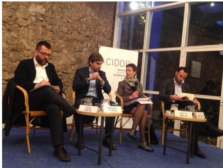
Ciclo “¿Qué pasa en el mundo?” Europe Reset: Nuevos rumbos para la UE. Sala Maragall, CIDOB, Barcelona, 18 de diciembre