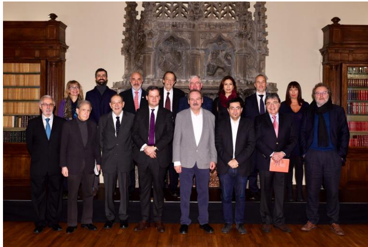
Colombia: el proceso de paz, Palacio de Pedralbes, Barcelona, 21 de enero