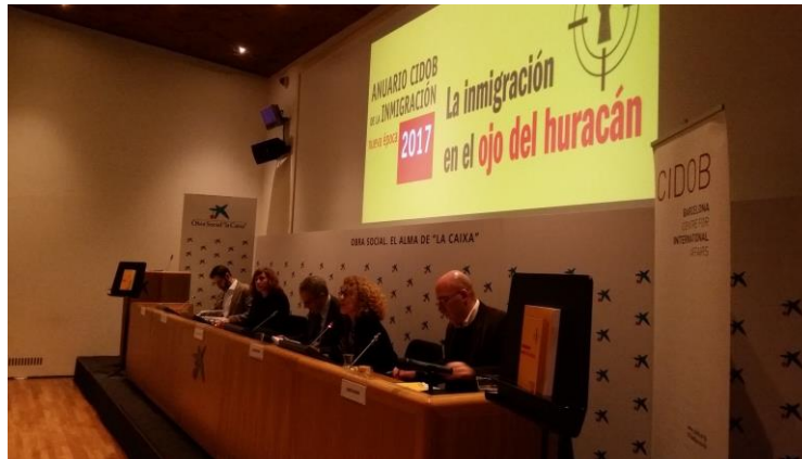
Presentación Anuario CIDOB de la Inmigración 2017: «La inmigración en el ojo del huracán» CaixaForum Madrid, 14 de diciembre de 2017