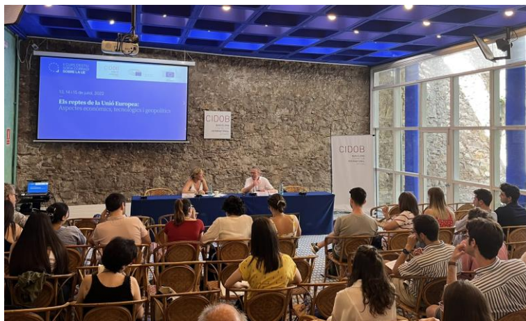
II Curs d'Estiu Sofia Corradi sobre la Unió Europea Sala Maragall, CIDOB, Barcelona, 13, 14 i 15 de juliol de 2022

Després de l'èxit de la primera edició, l'oficina del Parlament Europeu a Barcelona, la Representació de la Comissió Europea i el Centre for International Affairs (CIDOB) mantenen la seva aposta amb el segon curs d'estiu sobre la Unió Europea. Els tres dies lectius són sessions monogràfiques enfocades des d'una perspectiva teòrica i pràctica. Les sessions es divideixen en una intervenció per un key-note speaker de la Comissió o el Parlament Europeu, seguit d'un diàleg amb un periodista; i una taula rodona que compta amb investigadors de CIDOB; funcionaris de les institucions europees i experts independents. L'objectiu d'aquest curs d'estiu és oferir als participants una perspectiva completa dels debats i reptes de la Unió Europea a curt, mitjà i llarg termini, i dotar-los d'eines perquè puguin analitzar i comprendre la realitat europea i prendre partit de forma activa.