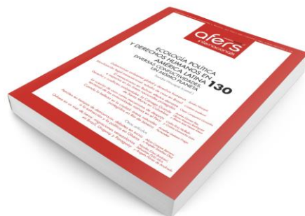
Revista CIDOB d'Afers Internacionals 130

ECOLOGÍA POLÍTICA Y DERECHOS HUMANOS EN AMÉRICA LATINA: diversas conflictividades, un mismo planeta