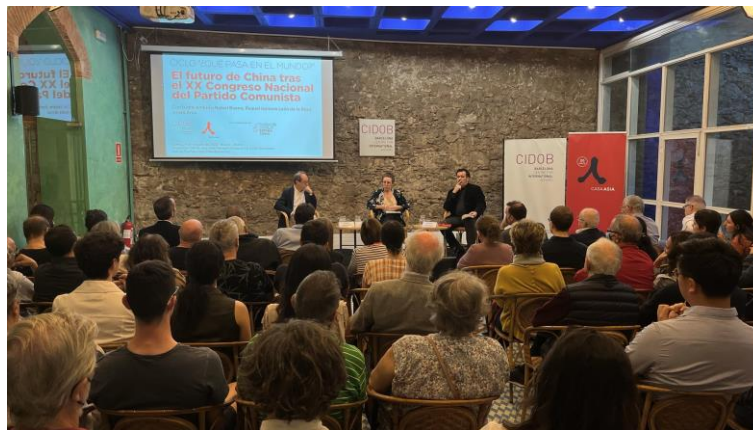
Cicle: “Què passa al món?” El futur de Xina després del XX Congrés Nacional del Partit Comunista. Sala Maragall, CIDOB, Barcelona, 24 d'octubre

Totes les sessions es retransmeten en directe a través del canal institucional de YouTube, on queden recollides per a la seva posterior consulta per part de les persones interessades: