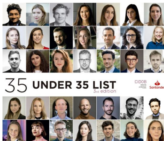
35 under 35 List

Per comprendre la multidimensionalitat d'aquesta situació, aquesta tercera edició del Santander-CIDOB Future Leaders Forum reflexionarà sobre les qüestions següents: Quins han de ser els propers passos de la UE a la recerca de la seva autonomia estratègica digital? Quin paper ha de tenir la ciberseguretat dins l'autonomia estratègica digital? Què ha de fer la Unió Europea per promoure el màxim potencial del mercat únic digital i quin paper hi tenen les dades? Quin impacte tindrà la nova Llei de Dades al panorama tecnològic europeu i quines oportunitats i riscos té per als usuaris? La UE pot equilibrar la seva voluntat de desenvolupar una autonomia digital estratègica i la innovació tecnològica depenent de quantitats massives de dades, mentre avança cap a una política regulatòria a favor del dret a la privadesa dels seus ciutadans? Com pot desenvolupar la UE la seva sobirania digital entre la rivalitat entre els Estats Units i la Xina i quin impacte pot tenir en el context de competició geopolítica i geoeconòmica actual? I finalment, la UE pot desenvolupar la seva sobirania digital sola en un món interdependent?