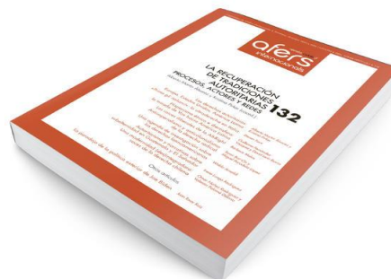
Revista CIDOB d'Afers Internacionals 132

LA RECUPERACIÓN DE TRADICIONES AUTORITARIAS: procesos, actores y redes