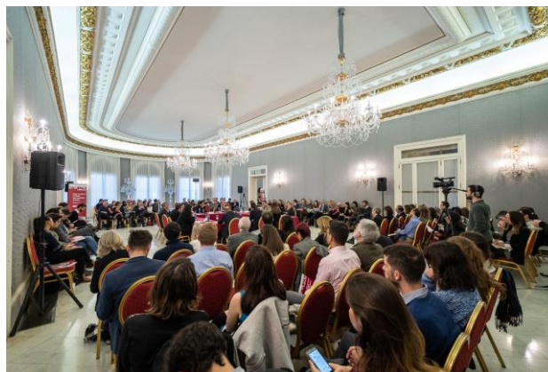
'Cities as places of refuge and promoters of peace', Palau de Pedralbes, 19 de gener de 2019