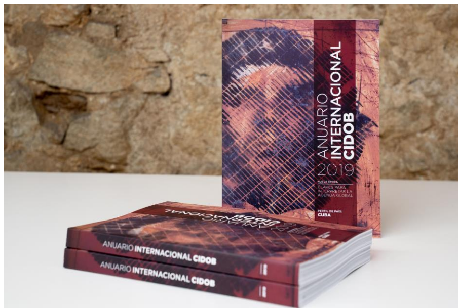
Anuario Internacional CIDOB 2019

En la seva 29 a edició i coincidint amb el 60è aniversari de la Revolució, l'Anuari dedica el seu Perfil de País a Cuba, un país que es debat entre la reforma i la continuïtat.