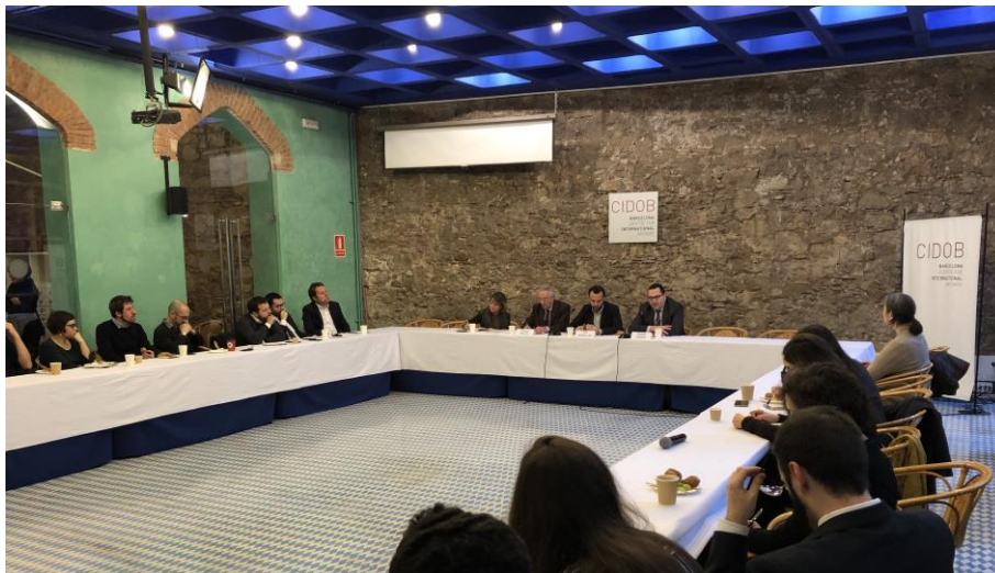
CIDOB In conversation with Rabah Arezki. Sala Maragall, CIDOB, Barcelona, 17 de gener.

El 2019, el CIDOB ha dut a terme un total de 57 actes, tant en la seva pròpia seu com en col·laboració amb altres institucions, que han comptat amb un total de 3.184 assistents (un increment del 21,9% respecte a l'any anterior).