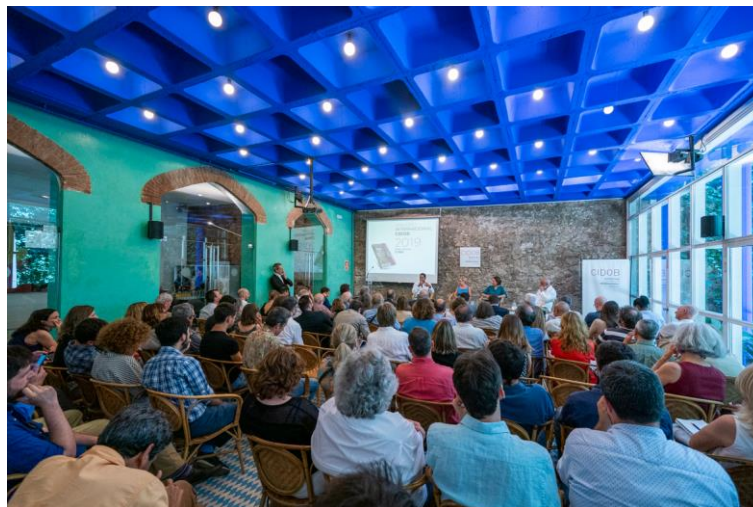
Presentació Anuari Internacional CIDOB 25 de juny de 2019, Sala Jordi Maragall

Mitjans de comunicació com La Vanguardia, RNE, TV3, Cadena Ser o el Diari Ara s'han fet ressò de la presentació de l' Anuario Internacional CIDOB 2019 i han entrevistat als participants en la mateixa.