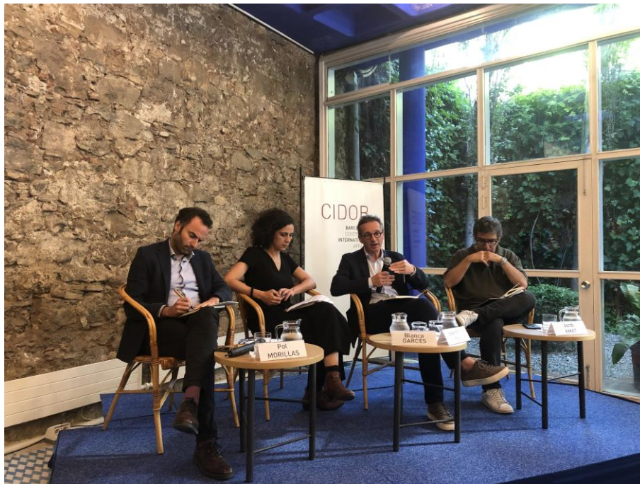
Cicle: "Què passa al món?" El Ciberleviatan i el col·lapse de la civilització democràtica i liberal davant la revolució digital. Sala Maragall, CIDOB. Barcelona, 12 de juny.