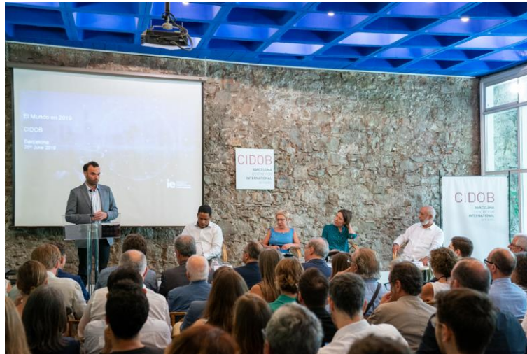
Presentació Anuario Internacional CIDOB 25 de juny de 2019, Sala Jordi Maragall