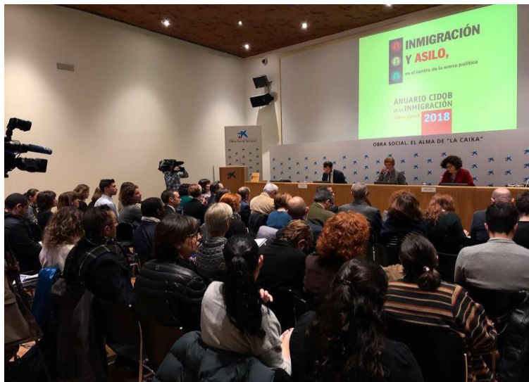
Presentació Anuario CIDOB de la Inmigración, 6 de febrer de 2019, CaixaForum Madrid

El 6 de febrer de 2019, la seu de CaixaForum Madrid va acollir la presentació de l' Anuario CIDOB de la Inmigración 2018 « Inmigración y asilo, en el centro de la arena política » amb un acte obert al públic celebrat entre les 9.30h i les 11.15h, que va comptar amb la participació de la secretària d'Estat de Migracions, Consuelo Rumí.