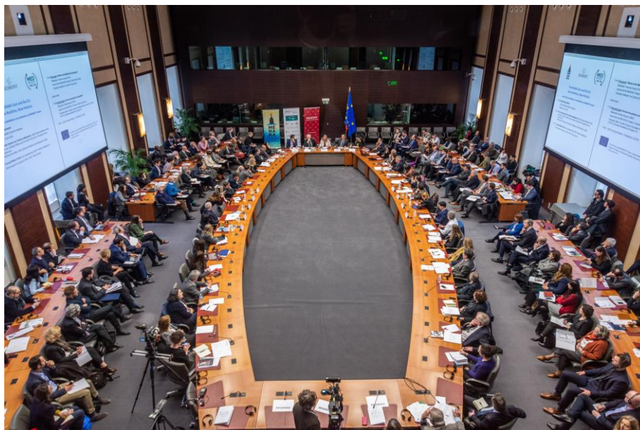
“L'Orient Mitjà i la UE: Noves realitats, noves polítiques” 6 de març de 2019, Egmont Palace, Brussel·les