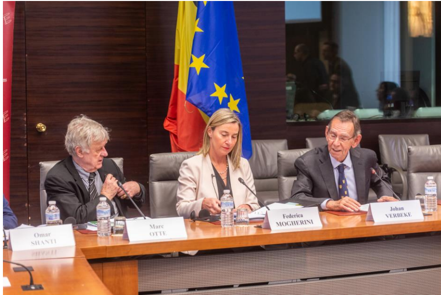
“L'Orient Mitjà i la UE: Noves realitats, noves polítiques” 6 de març de 2019, Egmont Palace, Brussel·les

El projecte MENARA ha reunit 14 centres de recerca de la UE, Turquia, el Magreb, el Mashreq i el Golf. El projecte ha analitzat els canvis geopolítics a l'Orient Mitjà i el Nord d'Àfrica, la polarització a nivell nacional, la fragmentació i el conflicte a nivell regional i l'augment del nombre d'actors globals que intervenen en aquesta regió en particular. Així mateix, ha realitzat nombroses missions de recerca (en països com Síria, Líbia i l'Iraq), al voltant de 300 entrevistes personals, una enquesta Delphi amb 71 experts, 3 focus group (Brussel·les, Rabat i Beirut) i 2 reunions amb stakeholders (Istanbul i Roma).